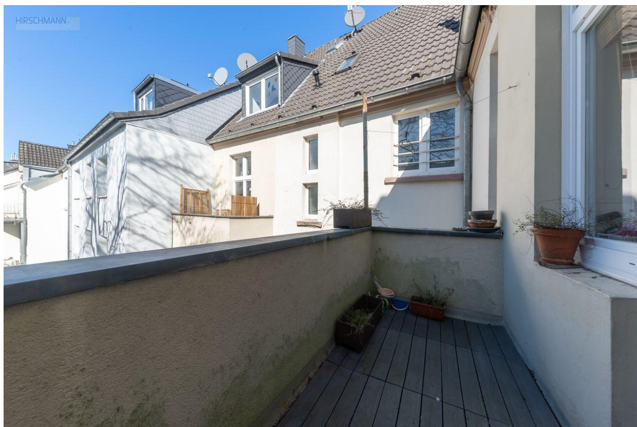
Balkon 2. OG