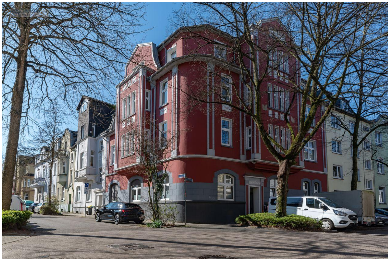
Mehrfamilienhaus in Frohnhausen