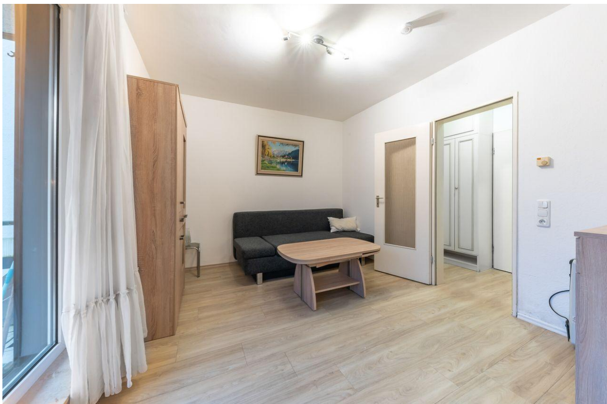
Wohnen, Schlafen, Leben