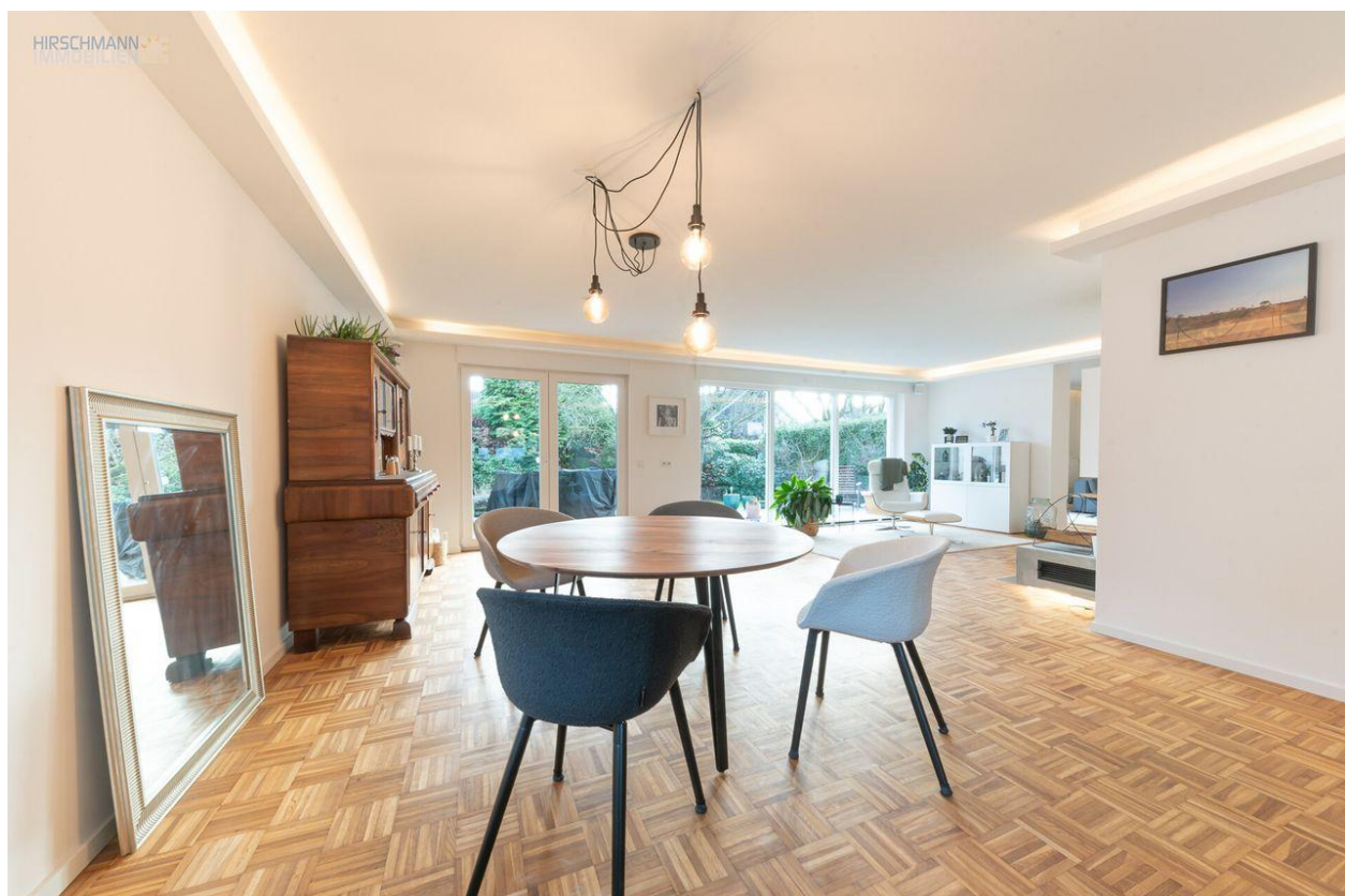
Essbereich von der Küche