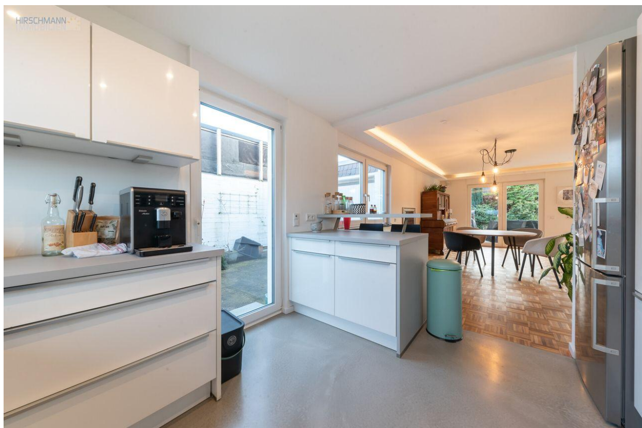
Ausschnitt aus der Küche