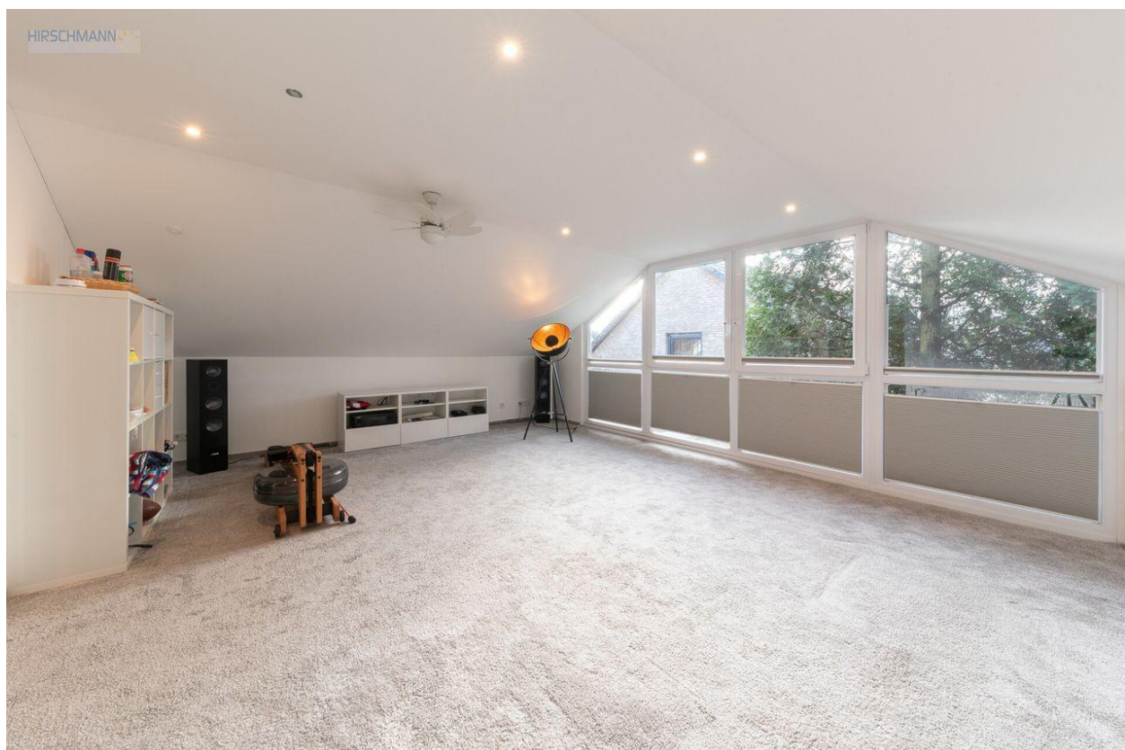
Schlafzimmer oder Kinderzimmer