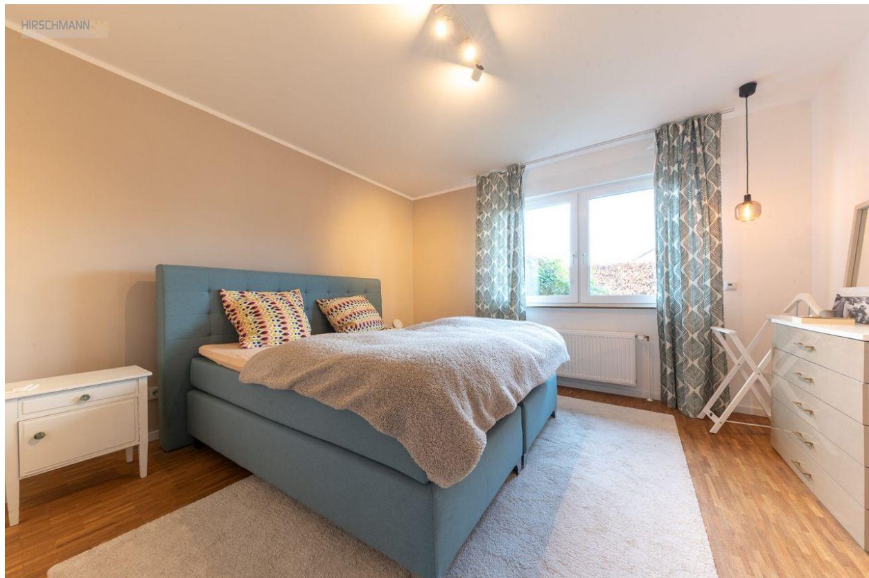
Schlafzimmer im Erdgeschoss