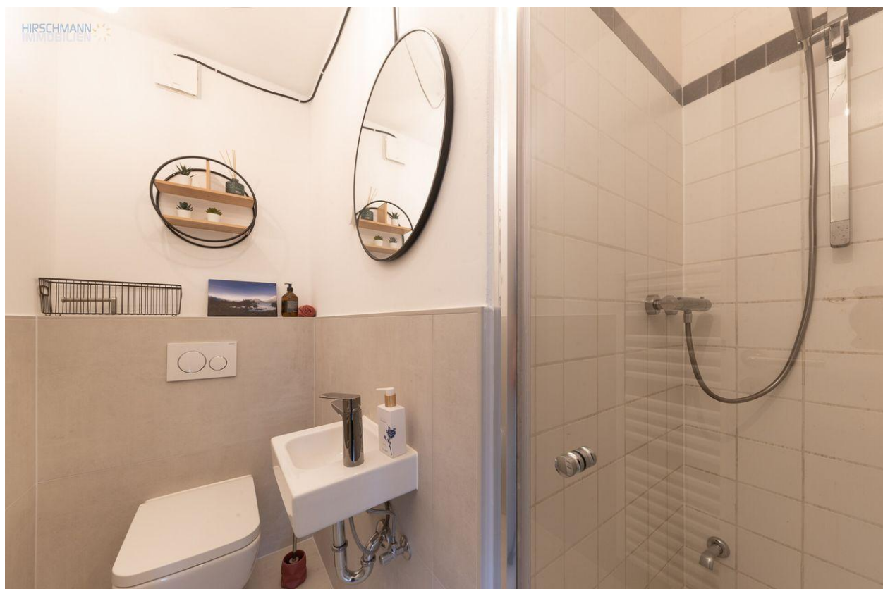
Gäste WC mit Dusche