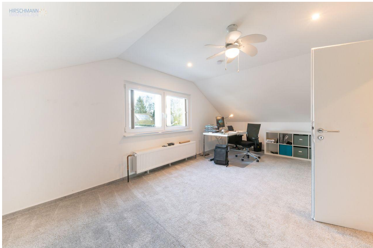
Kinderzimmer oder Homeoffice