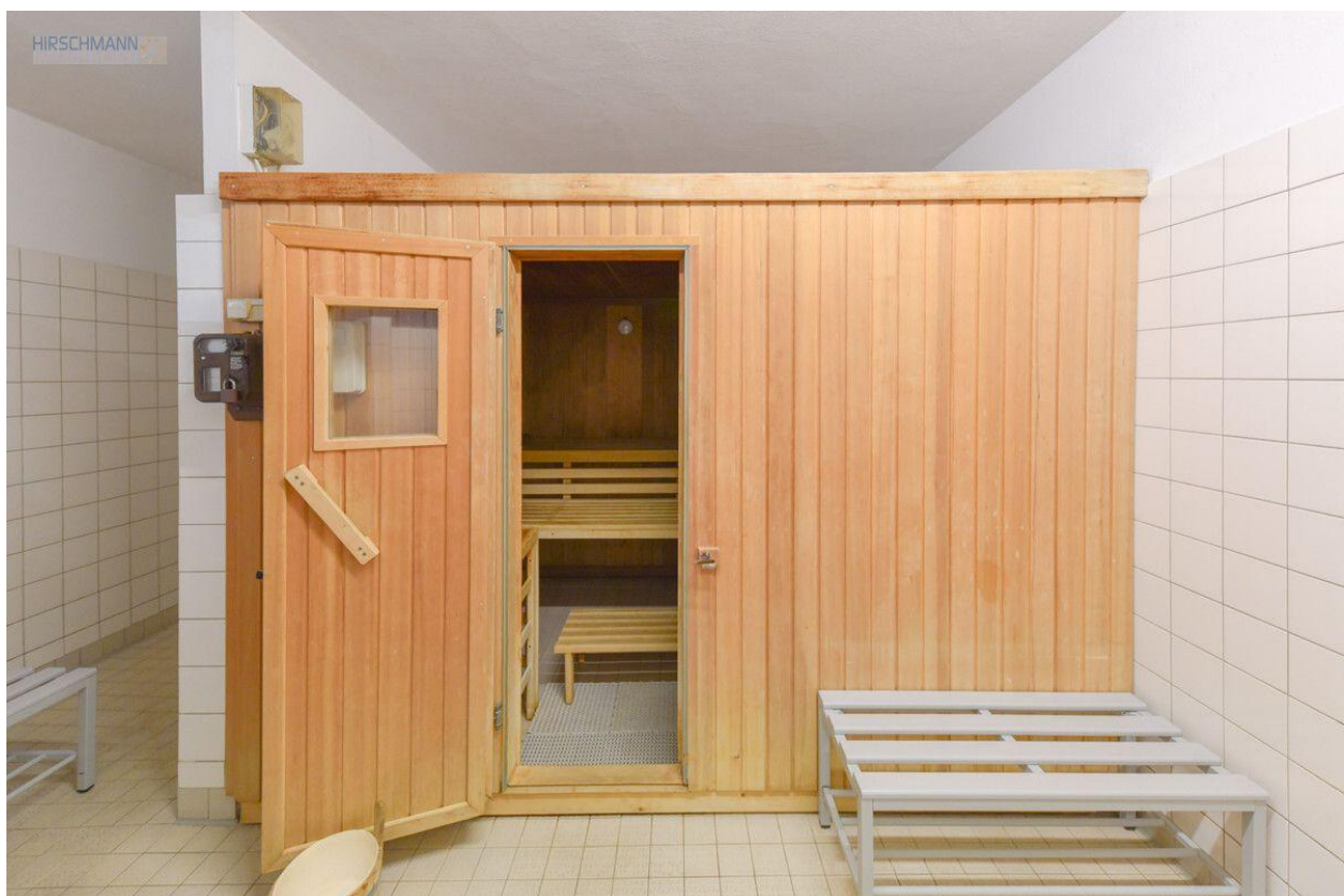
Sauna im Haus