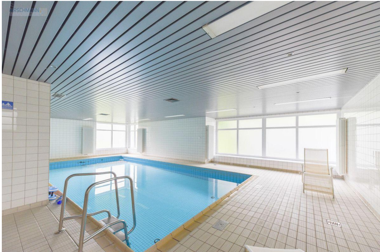
Schwimmbad im Haus