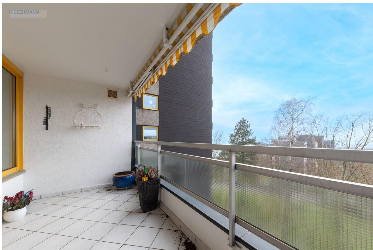
Aussicht andere Seite