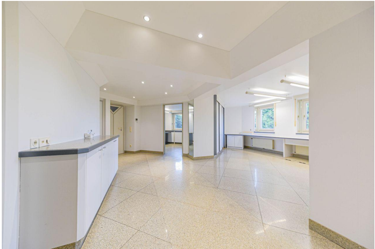
Flächen für Arbeitsplätze