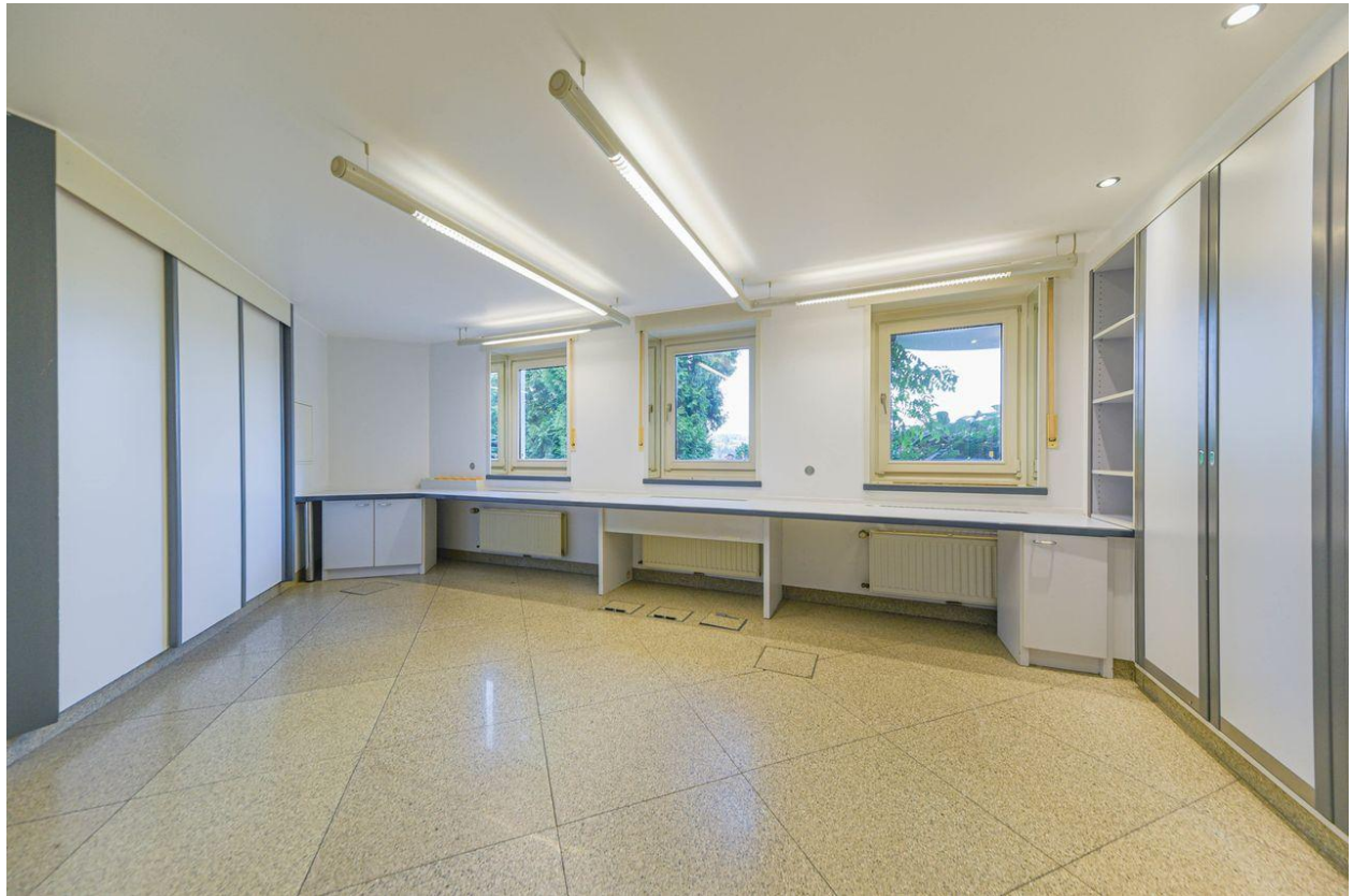
Flächen für Arbeitsplätze