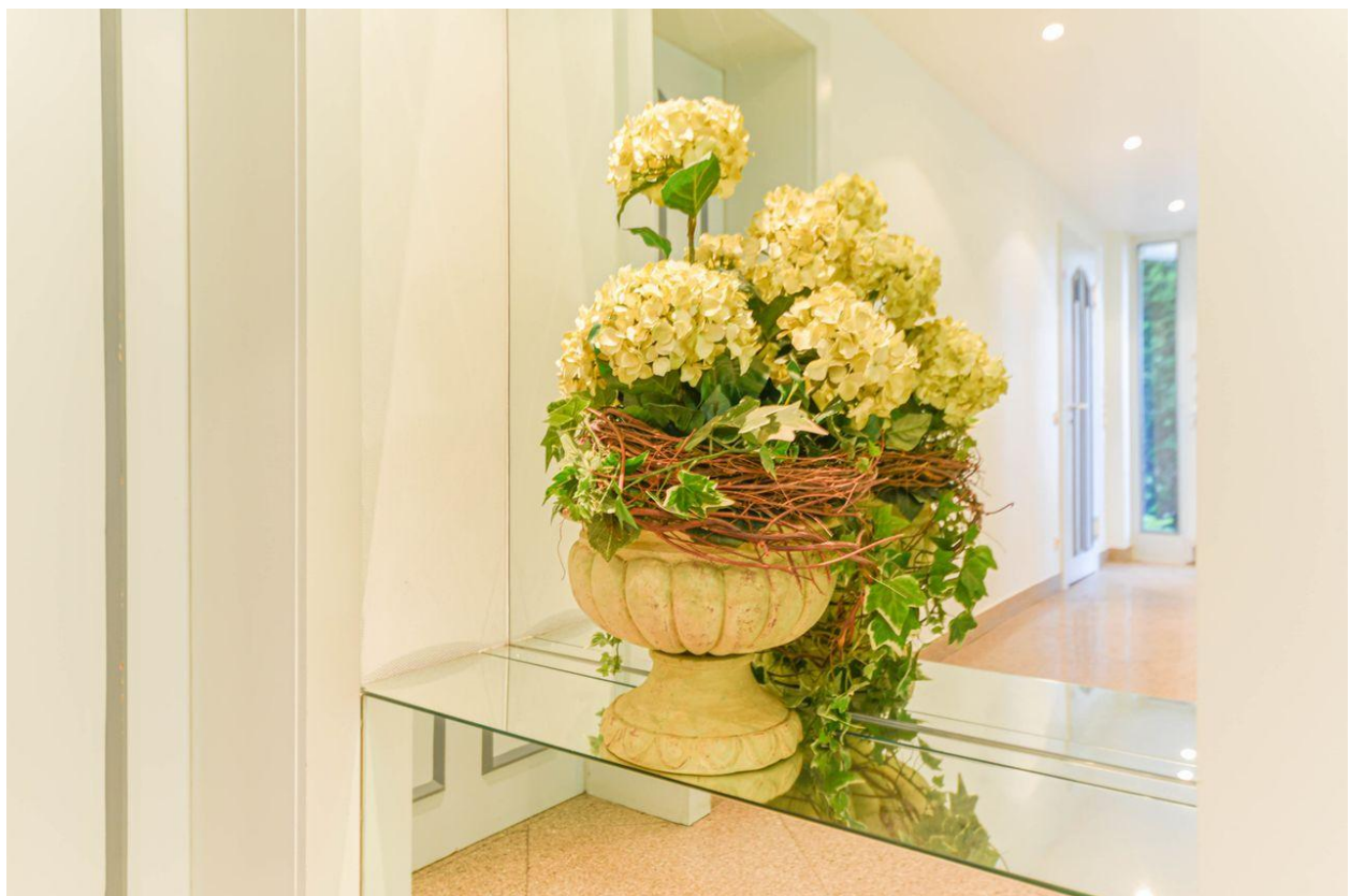
Blumen im Eingangsbereich