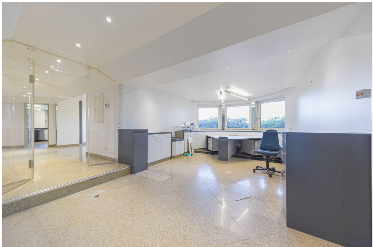
Flächen für Arbeitsplätze