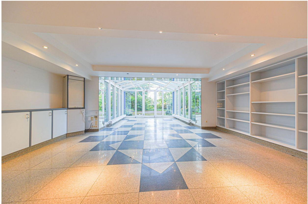
Geschäftsführerbüro mit Wintergarten