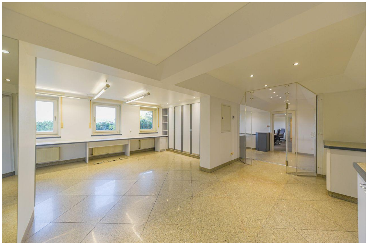
Flächen für Arbeitsplätze