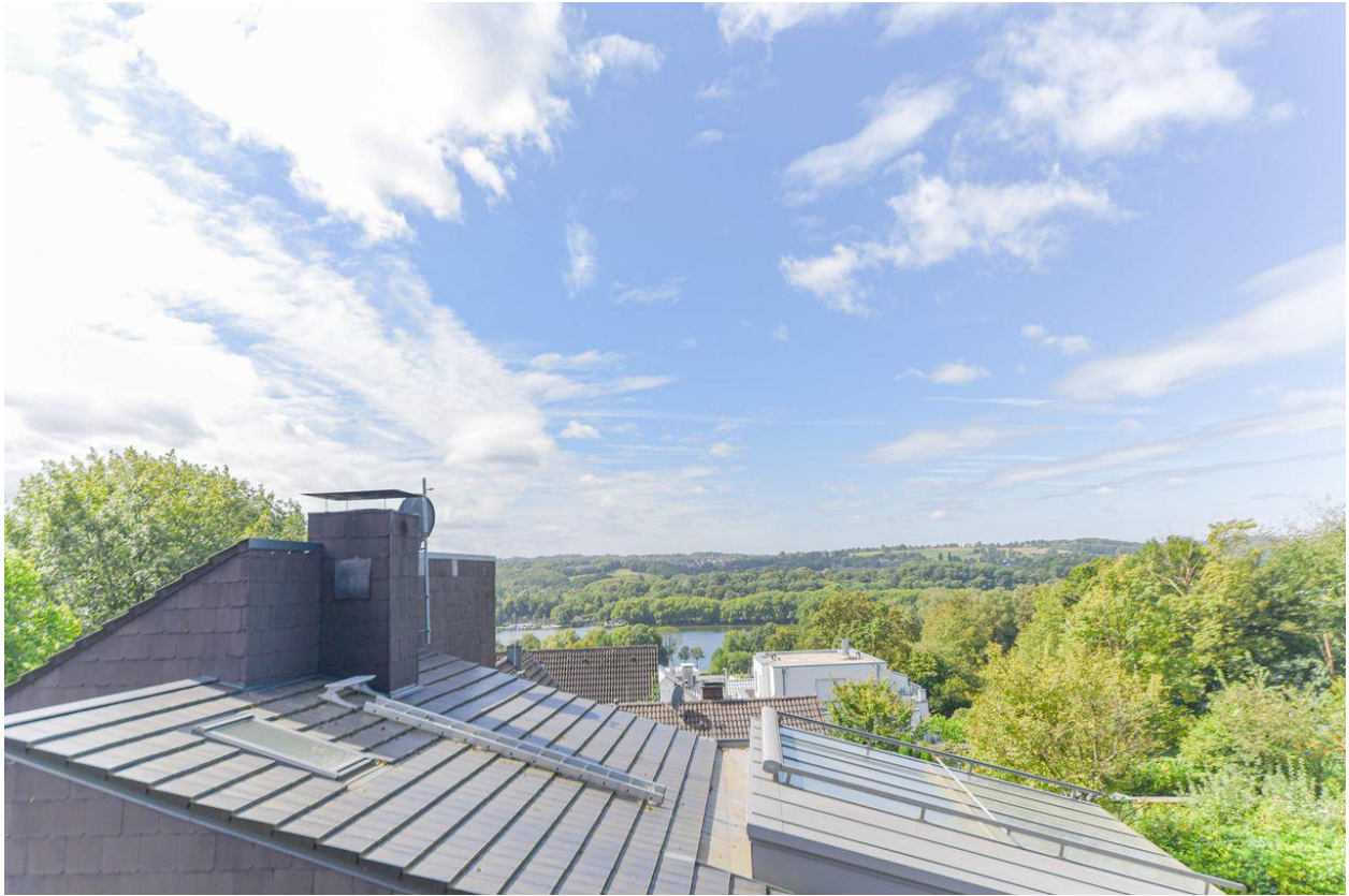
Ausblick auf den See