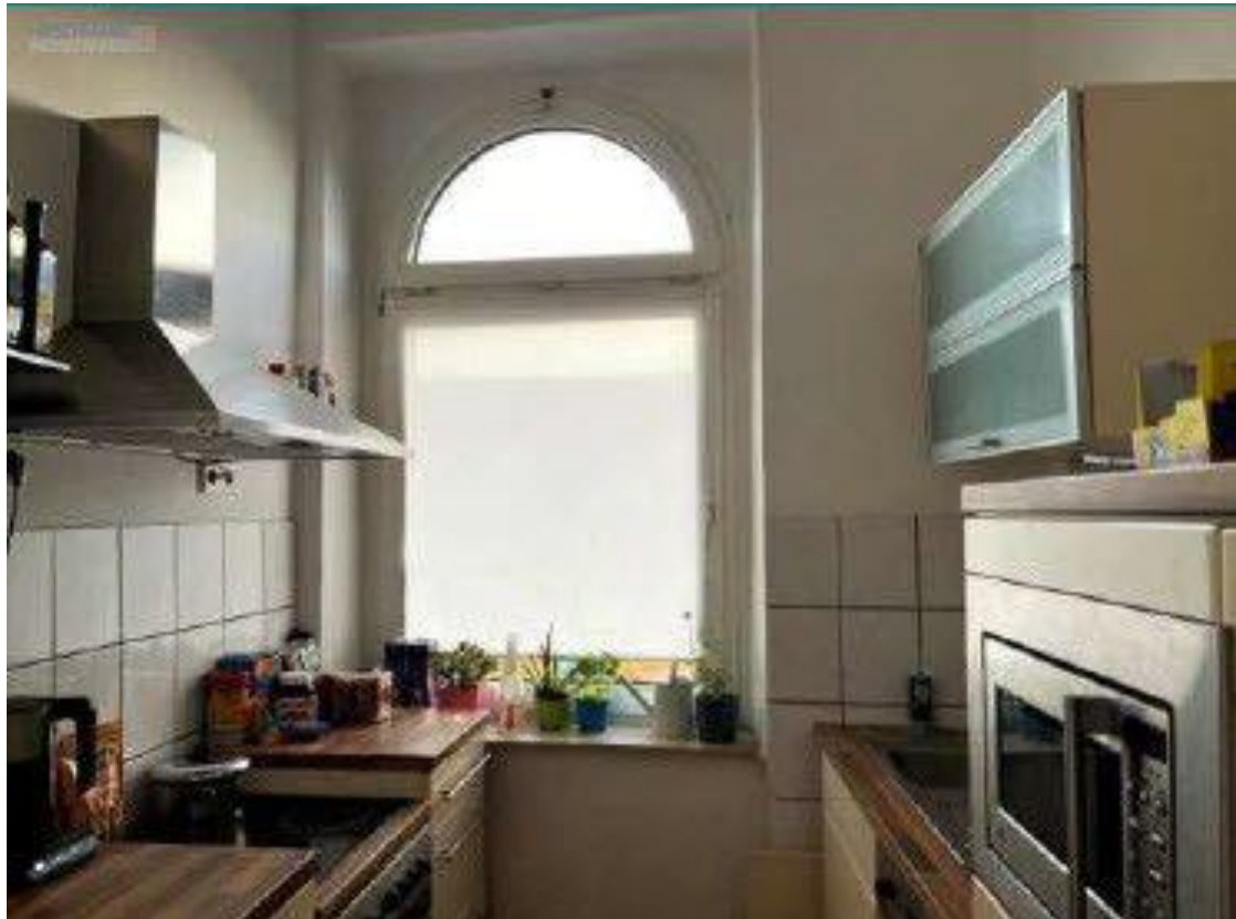
Bsp. Küche 174