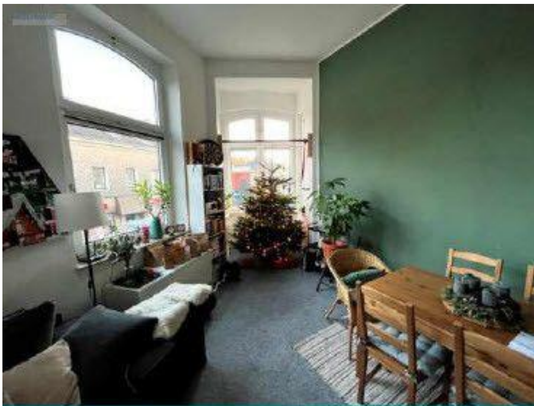
Bsp. Wohnung Haus 174