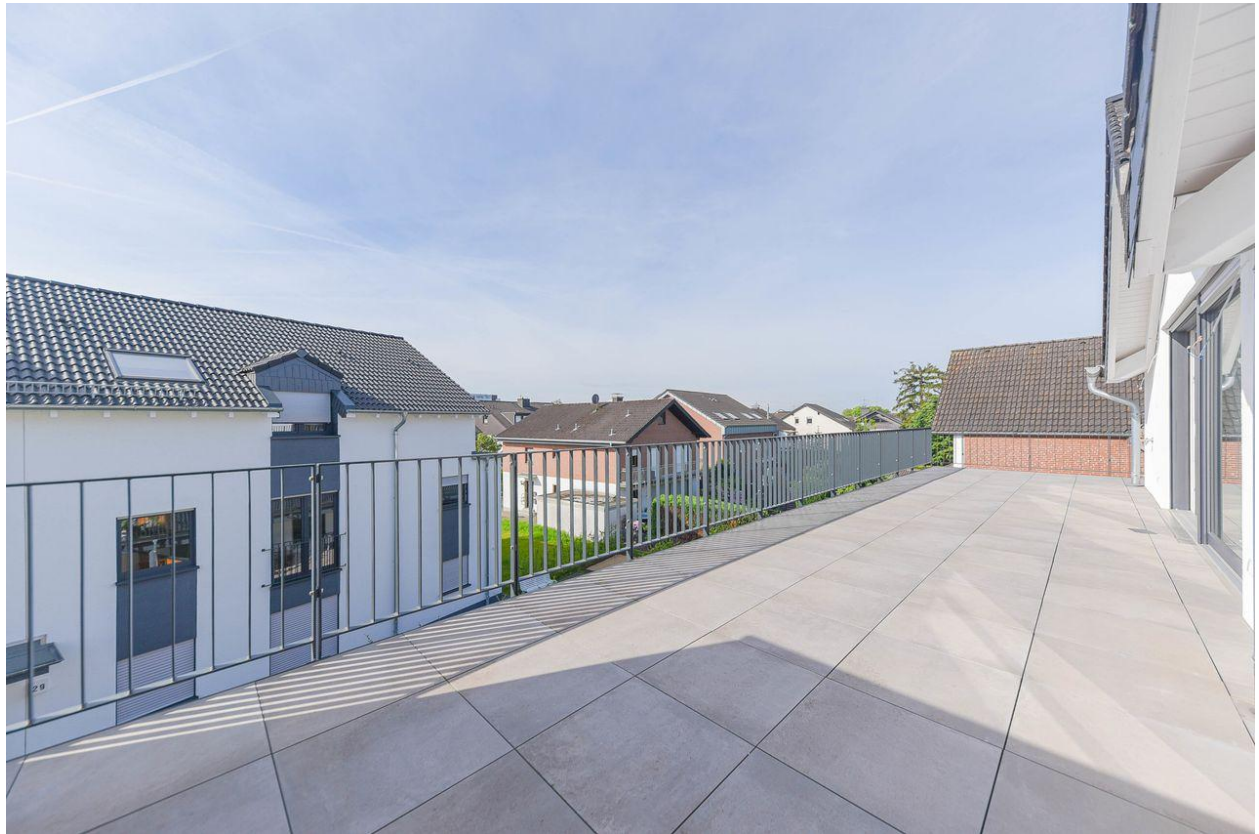
Terrasse mit Aussicht