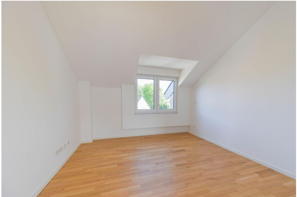
Home - Office