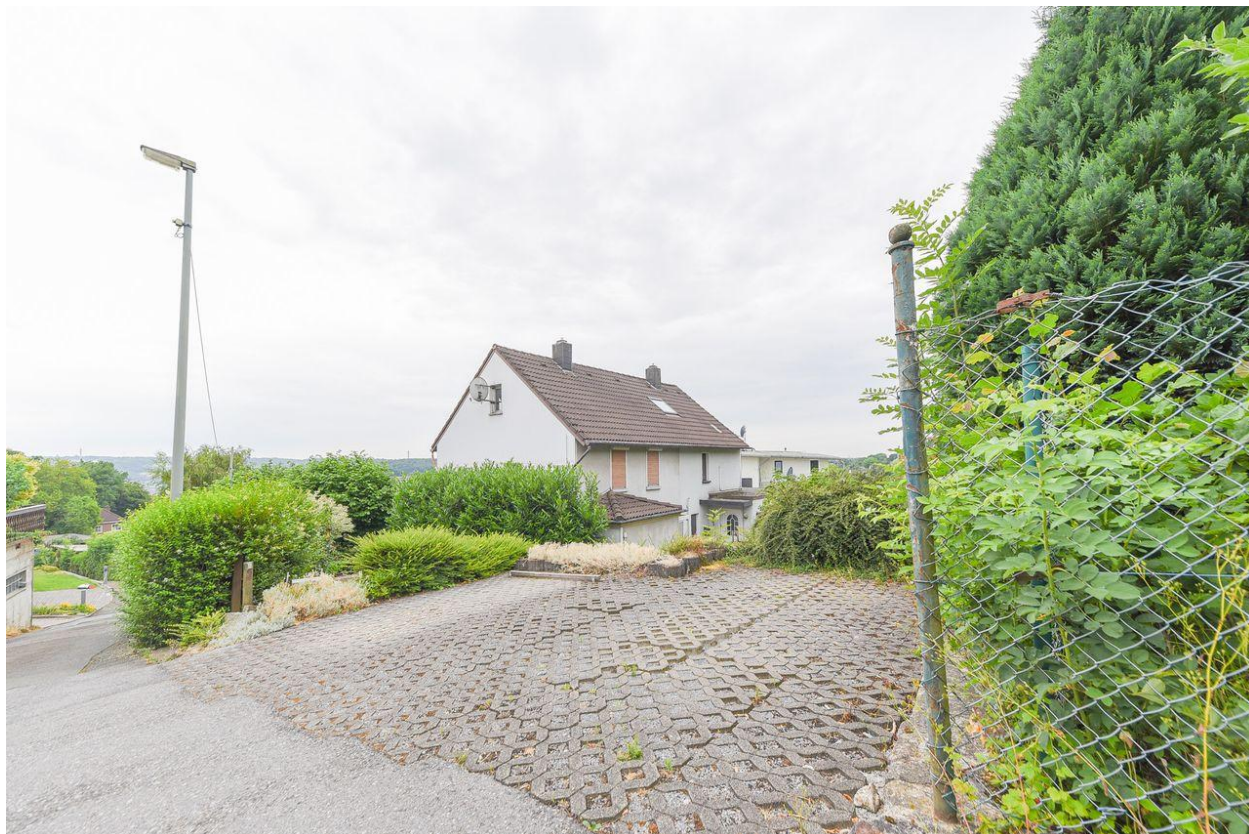
Freiplätze oberes Grundstück