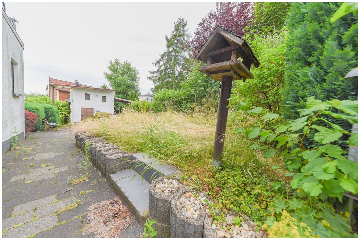
Blick auf Geräteschuppen