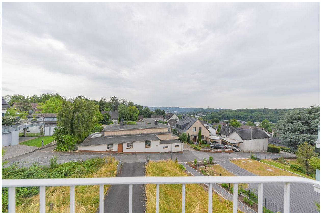
Blick über Wuppertal