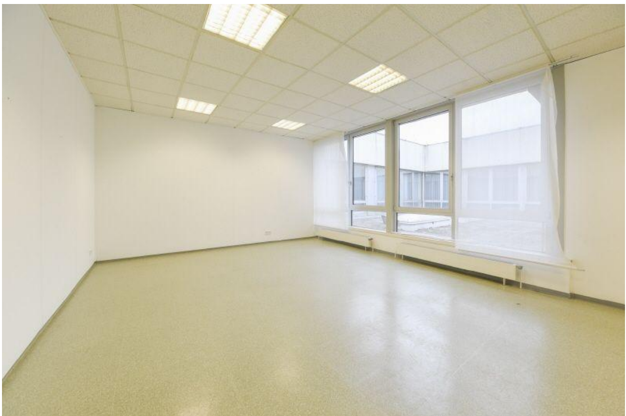
Pausenparadies für Ihre Mitarbeiter